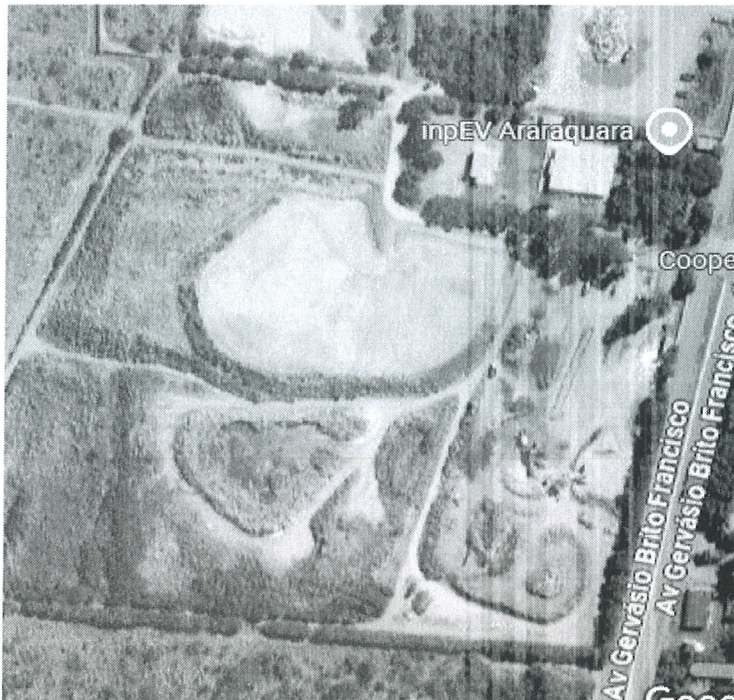
Figura 1: Imagem de Satélite da ETRCC- Daae

Avenida Gervásio Brito Francisco, nº 691 – Jardim Altos dos Pinheiros - Araraquara/SP