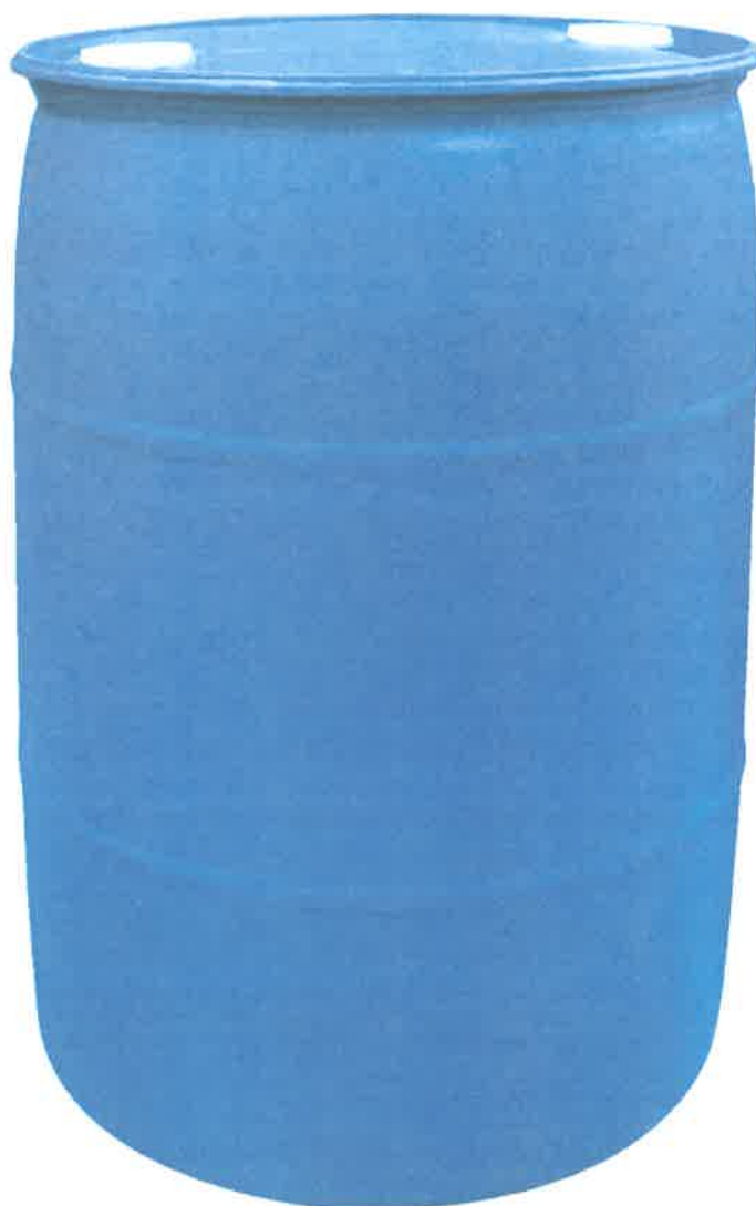
Tambor PE-HD 200 Litros