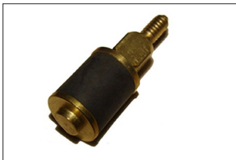
Exemplo de OB com encaixe quadrado e rosca externa

OBS.: É necessária a apresentação de 03 amostras de cada medida.