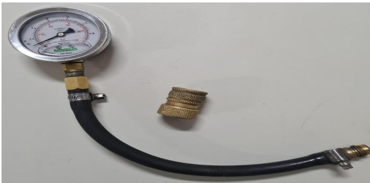
Exemplo: de manômetro de pressão com mangueira e engate rápido 3/4 (lote 1)