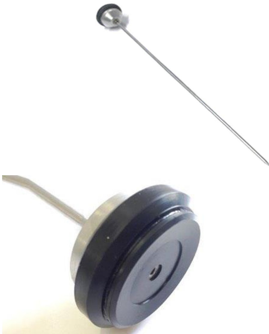
Exemplo: de Haste da Escuta (lote 4)