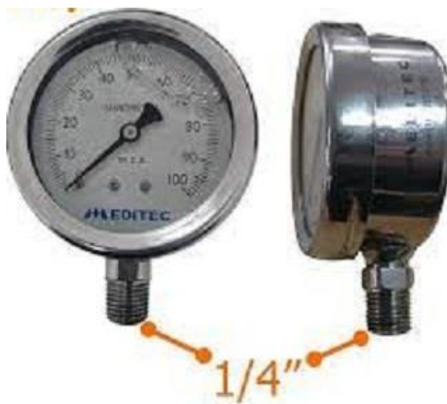
Exemplo: de manômetro de pressão (lote 2)