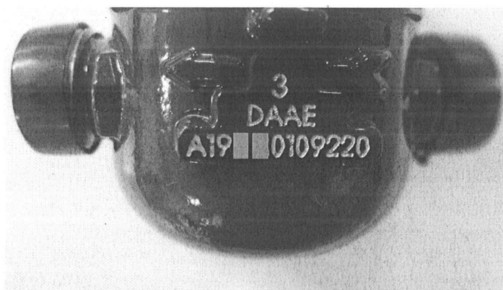
Foto 01 – Detalhe da inserção da sigla DAAE na carcaça do MEDIDOR.