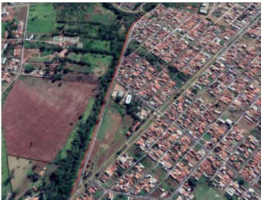
Imagem 1: Localização da Revitalização

Propriedade: Prefeitura Municipal de Araraquara.