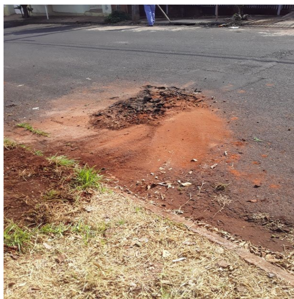
Interrupção no Rede