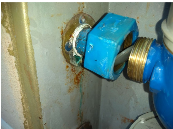
Interrupção no Hidrômetro