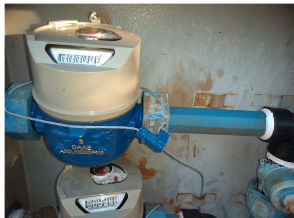
Interrupção no Hidrômetro