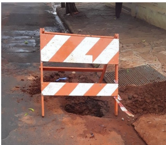
Interrupção no Rede