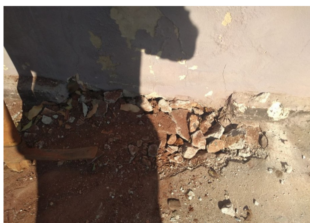
Interrupção no Ramal