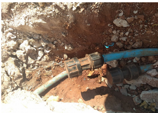
Interrupção no Ramal