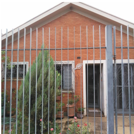
Visita de corte

As ordens de serviço serão enviadas pelo Smartphone, com sistema android 6 ou superior, e no mínimo 64 gb de memória, para a execução dos serviços.