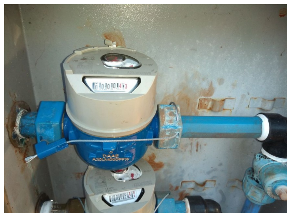
Interrupção no Hidrômetro