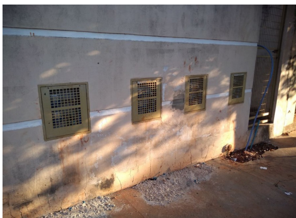
Interrupção no Hidrômetro