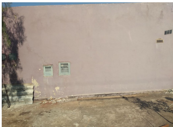
Interrupção no Ramal

As ordens de corte serão enviadas para o Smartphone, com sistema androide 6 ou superior, e no mínimo 64 gb de memória, para a execução do serviço.