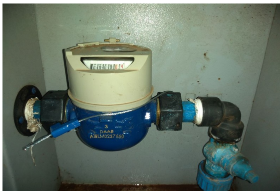
Restabelecimento no hidrômetro