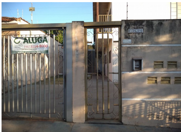
Interrupção no Hidrômetro

sistema android 6 ou superior, e no mínimo 64 gb de memória, para a execução do serviço.