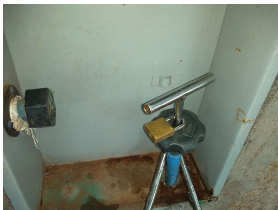
Restabelecimento no hidrômetro