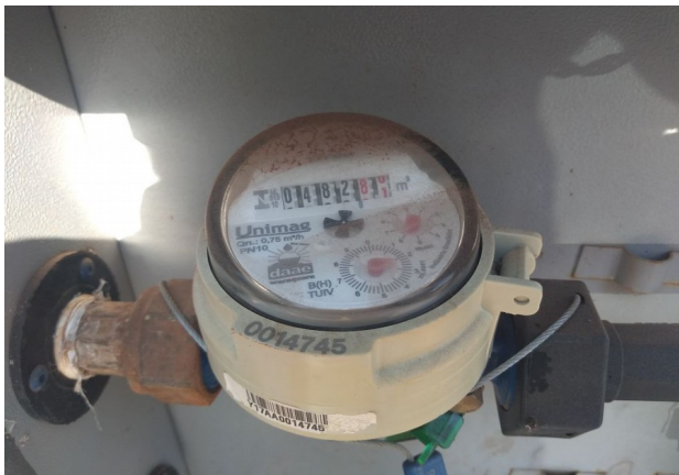
Interrupção no Ramal