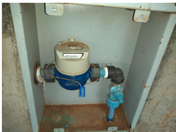
Restabelecimento no hidrômetro

As ordens de reabertura Ras serão enviadas para o Smartphone, com sistema android 6 ou superior, e no mínimo 64 gb de memória, para a execução do serviço.