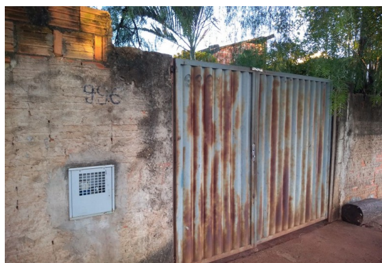
Restabelecimento no hidrômetro