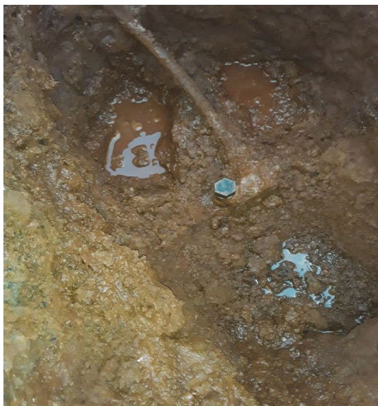
Interrupção no Rede

As ordens de corte serão enviadas para o Smartphone, com sistema androide 6 ou superior, e no mínimo 64 gb de memória, para a execução do serviço.