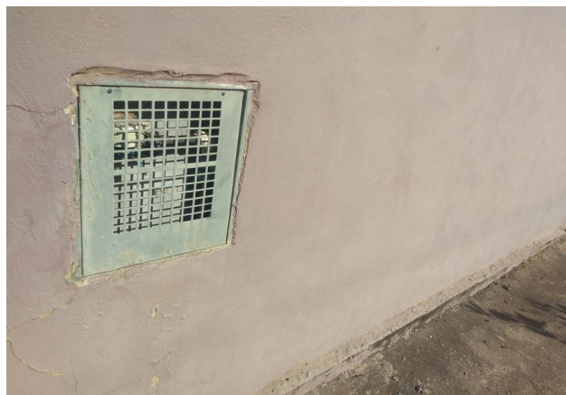
Interrupção no Ramal