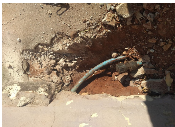
Interrupção no Ramal